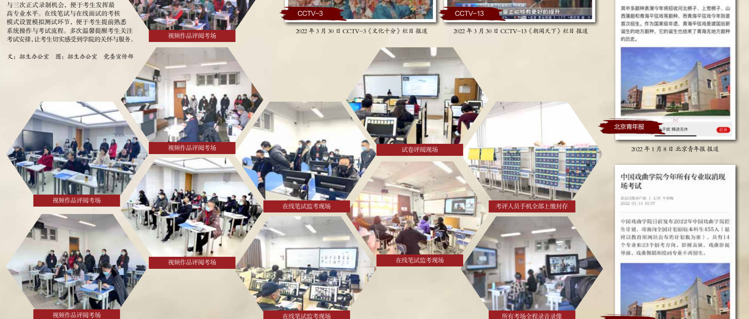
文：招生办公室 图：招生办公室 党委宣传部

以考生为本，提升考试服务水平，充分考虑考生利益，确保专业考试组织既能便捷高效，又能达到考核与选才目的。录制视频考核提供模拟考试与三次正式录制机会，便于考生发挥最高专业水平。在线笔试与在线面试的考核模式设置模拟测试环节，便于考生提前熟悉系统操作与考试流程。多次温馨提醒考生关注考试安排，让考生切实感受到学院的关怀与服务。