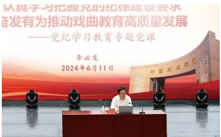
文：院办公室 图：党委宣传部

师生感到，通过这次专题党课，更加理解了坚强的党性、优良的党风、严明的党纪是我们党区别于其他政党的鲜明标识，也是我们这个百年大党饱经磨难而生生不息、久经考验、百炼成钢的奥秘所在。大家表示，将积极参加党纪学习教育，增强纪法意识，练就过硬本领，厚植事业情怀，建设好中国一流、世界知名戏曲艺术大学。