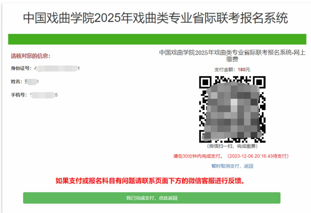
图表 3.8 (在线缴纳考试报名费, 可使用微信、支付宝、网银支付)